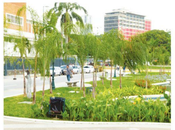
•CORTESÍA YRAMA CAPOTE/GRUPO ECOLOGICO SAN PEDRO

por el Jardín Botánico donde sí se respeta el diseño del paisajismo original. El desencanto se extiende al Paseo Los Ilustres donde se notan igualmente en la alteración del paisajismo original, pisos mal colocados pero sobre todo en la tala de caobos para ser sustituidos por palmeras. ¿Habrá algún negocio con la madera? Conviene hacer una investigación de esos trabajos para solventar errores, de lo contrario sería la destrucción de un patrimonio de la nación.